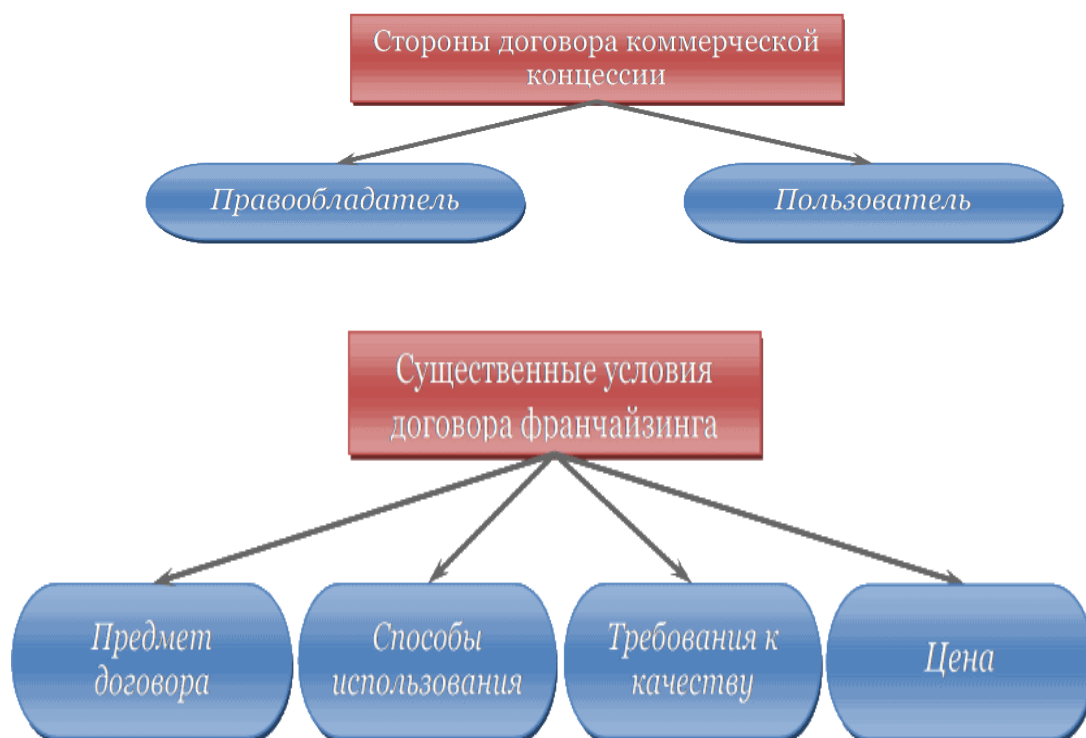
Рисунок 3 – Содержание договора коммерческой концессии

Нумерация листов курсовой работы должна быть сквозной для текста и приложений, начиная с титульного листа. Проставляется нумерация с третьего листа (титульный лист и задание не нумеруются). Номер листа проставляется в справа внизу шрифтом Times New Roman.